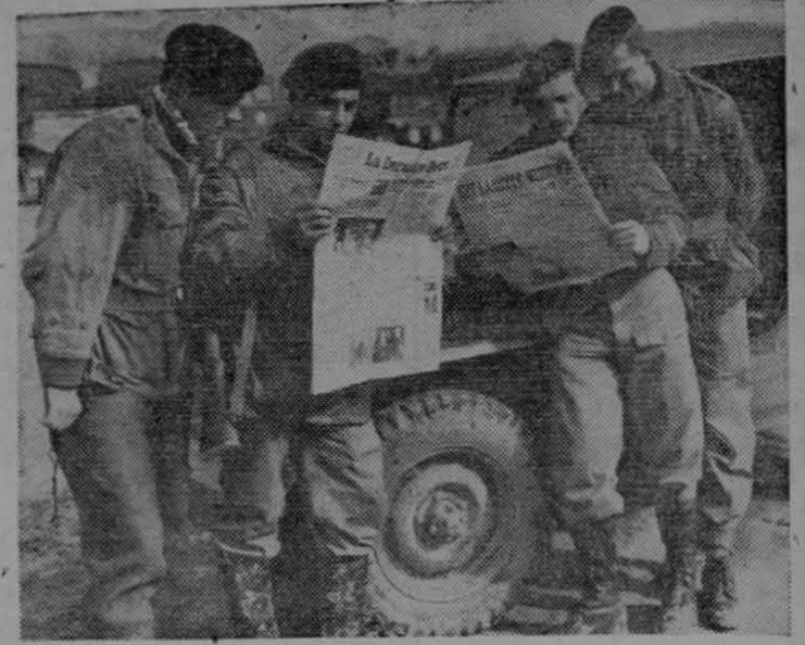
Varios soldados de Infantería de Bélgica, leen periódicos de su patria durante un breve descanso después de los combates en que han participado como miembros de las fuerzas de las Naciones Unidas que luchan contra la agresión comunista en Corea.

Se puede servir caliente o frío. Para seis personas.